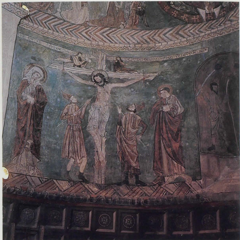
Jaunaren Gurutz-hiltzapena. Abside eskuin aldean.

Hauek izkutuan egon izan dira, Pedro de Arenalek, XVIII. mendean, eraikitako erretaula atzean, garai hartan egin zen eliz-apaindurak kare-jantzigain azpian hartu bait zituen. Baina 1967.urtean eginiko eliz-berrizaketak berreskuratu zizkigun.