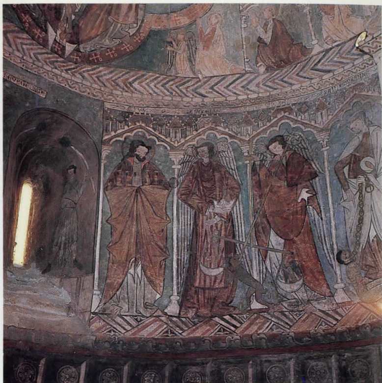
Azken-auzia eta Abraham-en Altxoa. Abside ezker aldean.