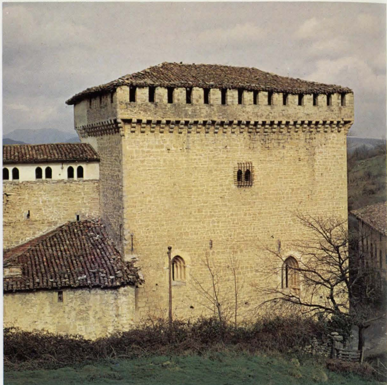
Casa-Torre del Canciller.