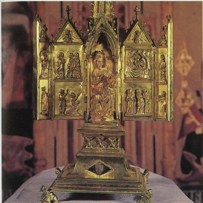
Relicario de la Virgen del Cabello.

Orden de Santo Domingo, que diariamente venera a la Virgen María, en su devoción de Nuestra Señora del Cabello, que constituye la principal joya donada al convento por su fundador.