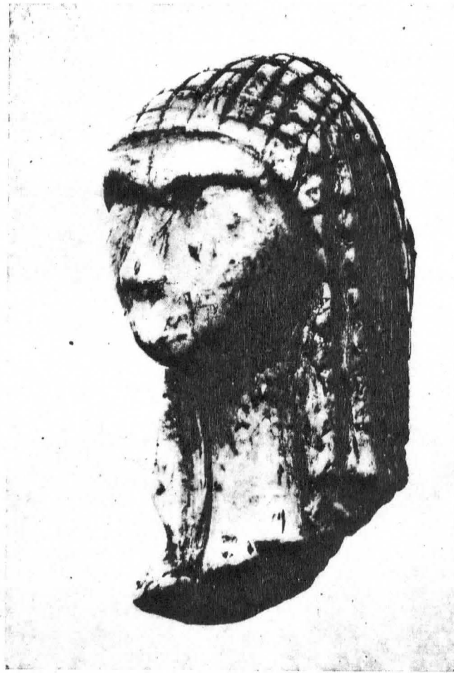
La Tête de Brassempouy.

Correspondant des Directions des Antiquités préhistoriques et historiques d'Aquitaine