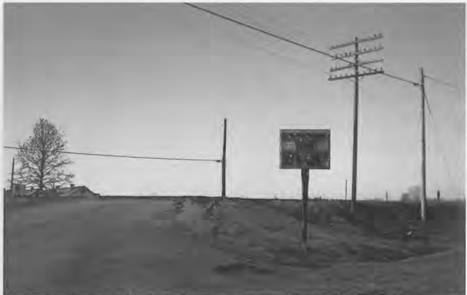
Southern Suite (The stop sign). William Eggleston, 1981.

Argumentua hitz gutxitan kontatzea asko kostatzen zait, sintesi lan hori egitea ia ezinezko zaidalako, ez baitut gai zehatz baten inguruan idatzi jakinaren gainean eta ez dudalako nahi orain