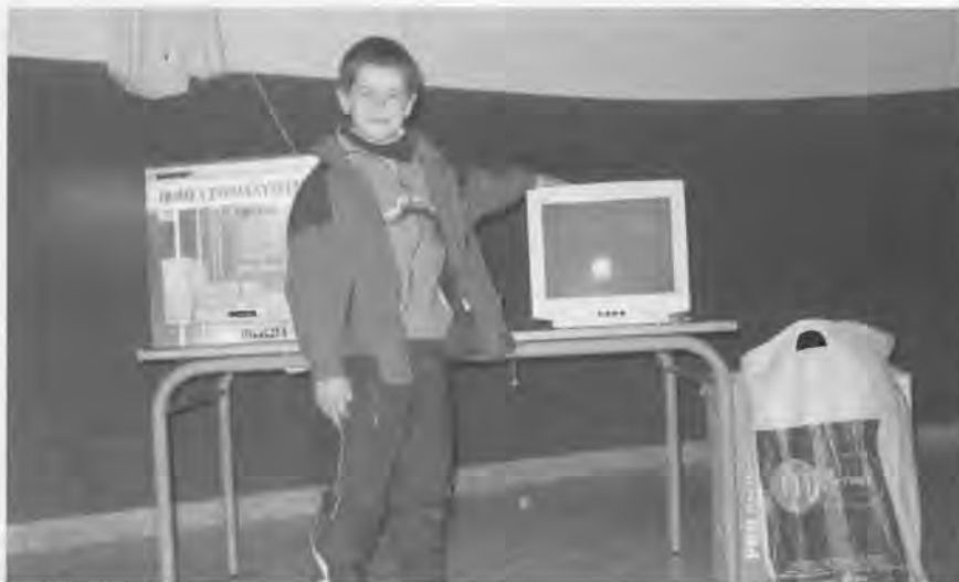
Lehiaketa kulturalaren sari banaketa.