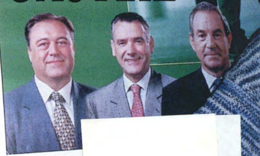
Jose Ibarretxe karirako Hautagaio