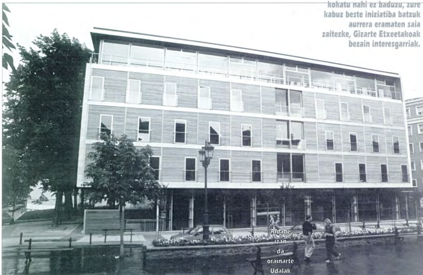
Aldabe izan da orainarte Udalak

Nahi izan arren egunero ezin daiteke jairik jai ibili; zoritxarrez, astean zehar ikastetxean zein lantokian zereginak bete behar dira-eta. Hala ere, hauek burutu bezain pronto gure aisialdiaz goza gaitetzke, eta non baino hobeto Gasteizko Gizarte Etxeetan ez bada. Kirol aukera anitzez aparte beste hainbeste ekitaldi interesgarri eskaintzen dira. Nolanahi ere, zure burua lau pareta artean kokatu nahi ez baduzu, zure kabuz beste inizatiba batzuk aurrera eramaten saia zaitetzke, Gizarte Etxetakoak bezain interesgarriak.