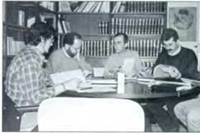
Bilera anitz burutu dira jada kale izendegiaren auzia bide onetik joan dadin. Irudian horietako bilkura bat.

-Noiz ezagutuko dugu hiritarrok? Eta noiz erabiliko? Zenbat denbora beharko dugu txip mentala, aldatzeko eta ohitzeko kale-izenak euskaraz idazten eta erabiltzen? Eta ordenagailuetako, (hau ere txipa al da?) fitxeroak eta pegatinak euskaratzeko?