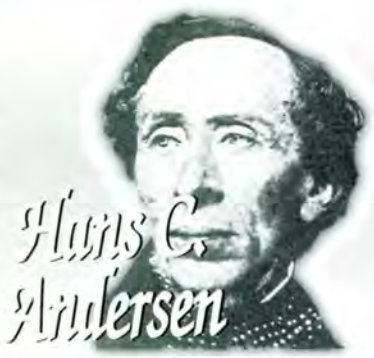
Hans C. Andersen

Hans Christian Andersen dudarik gabe inoiz haurrentzako literaturak eman duen idazlerik ospetsuena da. Danimarkako Odensen jaio zen 1805 urtean eta 70 urte berandua go hil. XIX. mendeko autorea izan zen, beraz, Andersen.