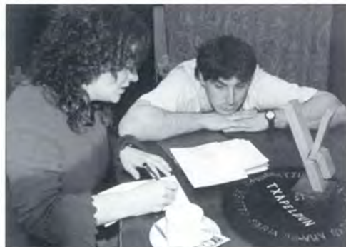
Biharamona erreflexiorako eguna izan zuten txapeldun eta txapeldunordeak. Baita errebantzarako ere!