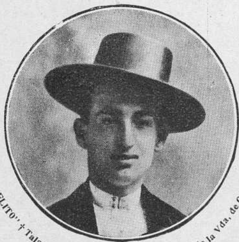
“JOSELITO” † Talavera 16 MAYO 1920 - “Bailador”, de la Vda. de Ortega.