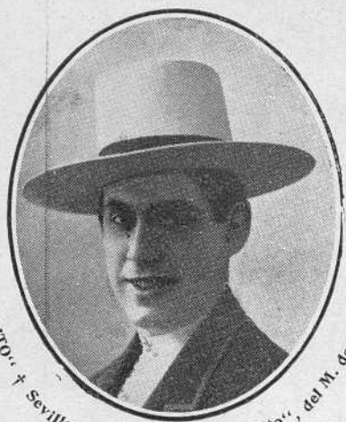
“VARELITO” † Sevilla 13 MAYO 1922 - “Bombito”, del M. de Guadalest.