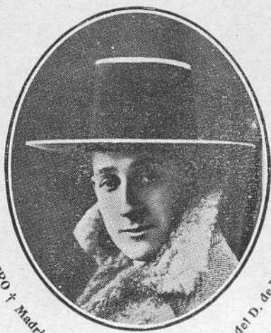
GRANERO † Madrid 7 MAYO 1922 - “Porapenti”, del D. de Veragua.