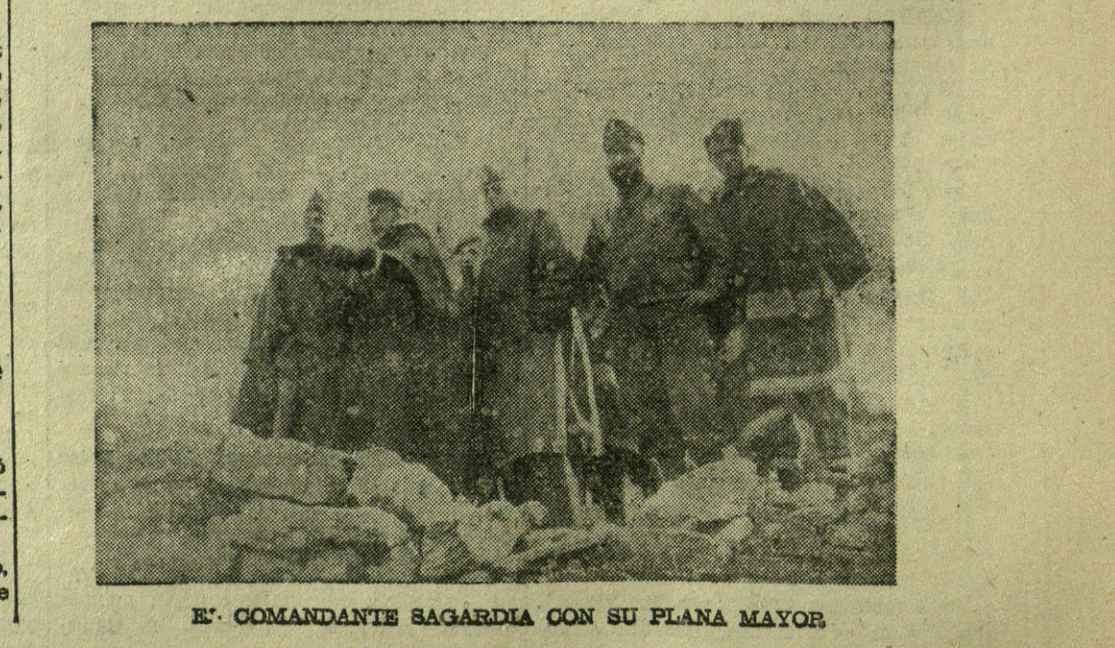
El Comandante Sagardia con su plana mayor