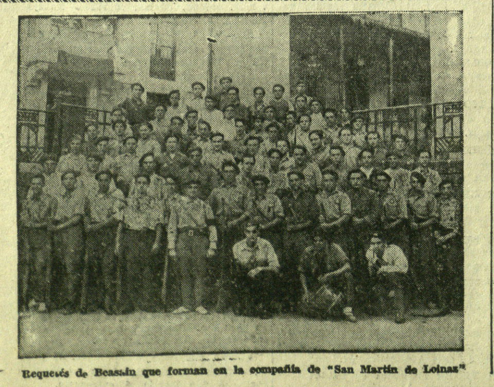
Requetés de Bessón que forman en la compañía de «San Martín de Idoias»